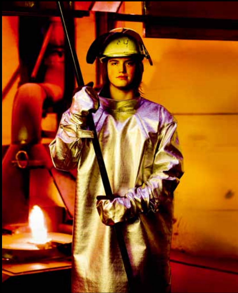
© BRUNO EHRS, "RADNIK U ŽELEZARI", BOLIDEN, ŠVEDSKA