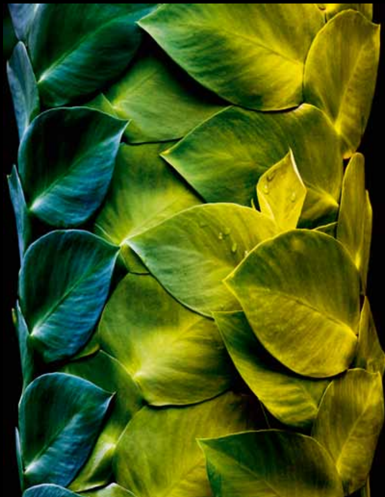
© BRUNO EHRS, "DRVO SA LIŠĆEM", CHANG MAI, THAILAND.

Još uvek mlad, žudeo sam za novim izazovima i radom na terenu. Posle dve godine rada u muzeju, opet igrom sluča-