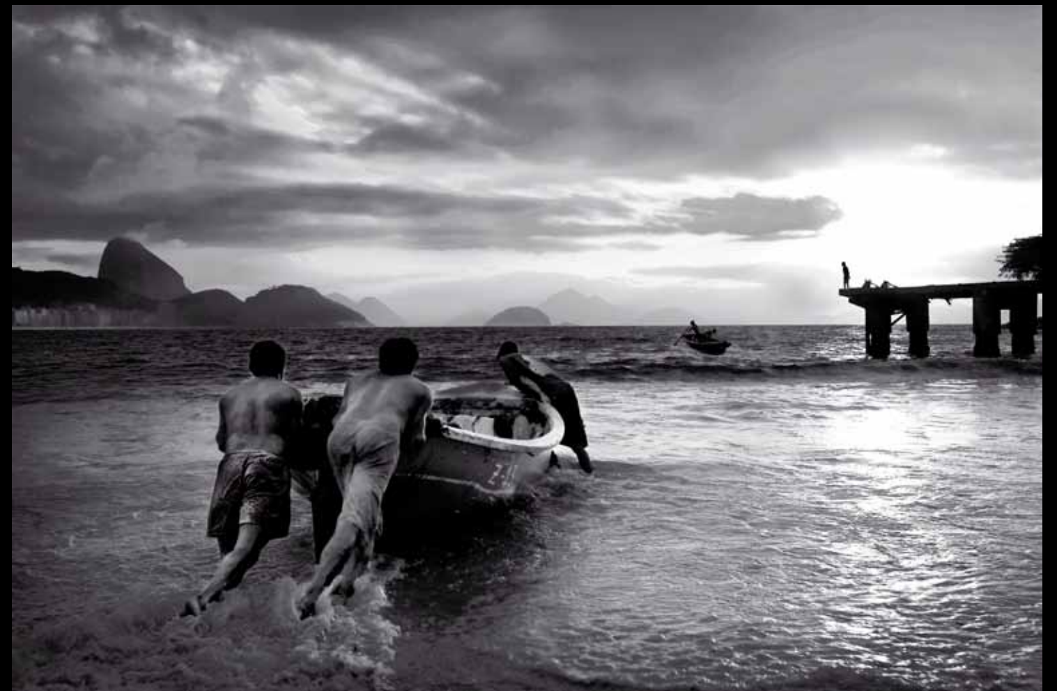
© BRUNO EHRS, "POSLEDNJI RIBARSKI ČAMAC ODLAZI SA PLAŽE", KOPAKABANA, RIO DE ŽENEIRO