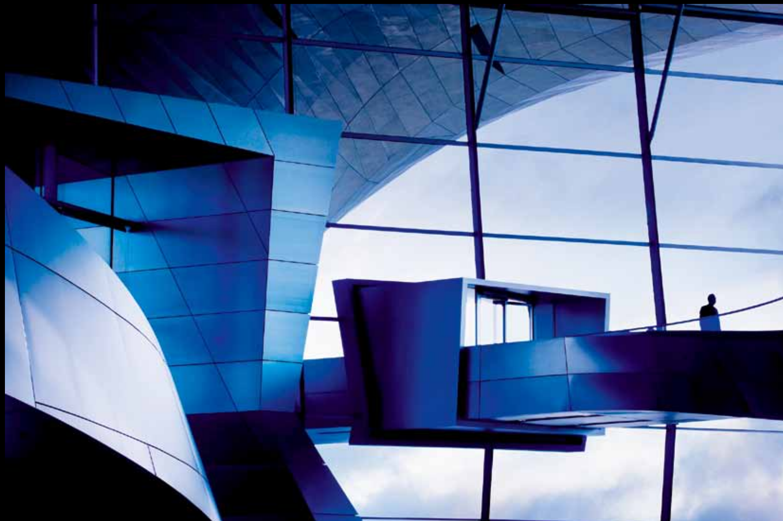
© BRUNO EHRS, "ZGRADA BMW-A", MINHEN, NEMAČKA