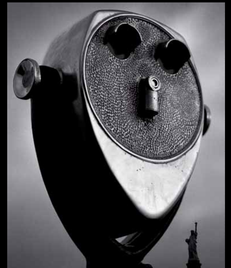
© BRUNO EHRS, "DVOGLED I SPOMENIK SLOBODE", BATTERY PARK, NJU JORK

Dva dana kasnije, osvetlio sam sobu tako da imitira meko januarsko svetlo koje se probija kroz prozore. Napravio sam nekoliko proba s lutkama obučenim u kraljevsku odeću da bih video kakvo je svetlo i pronašao pravu kompoziciju. Posle nekoliko sati, umesto lutaka, ispred mene su se nalazili članovi kraljevske porodice. Trema je rasla u meni. Sada je bilo vreme za fotografisanje, počnimo.