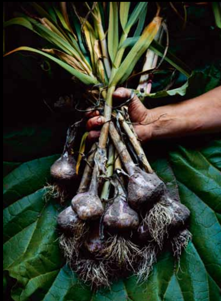
© BRUNO EHRS, "BEL LUK SA PARMETZ GOTLANDA", ŠVEDSKA