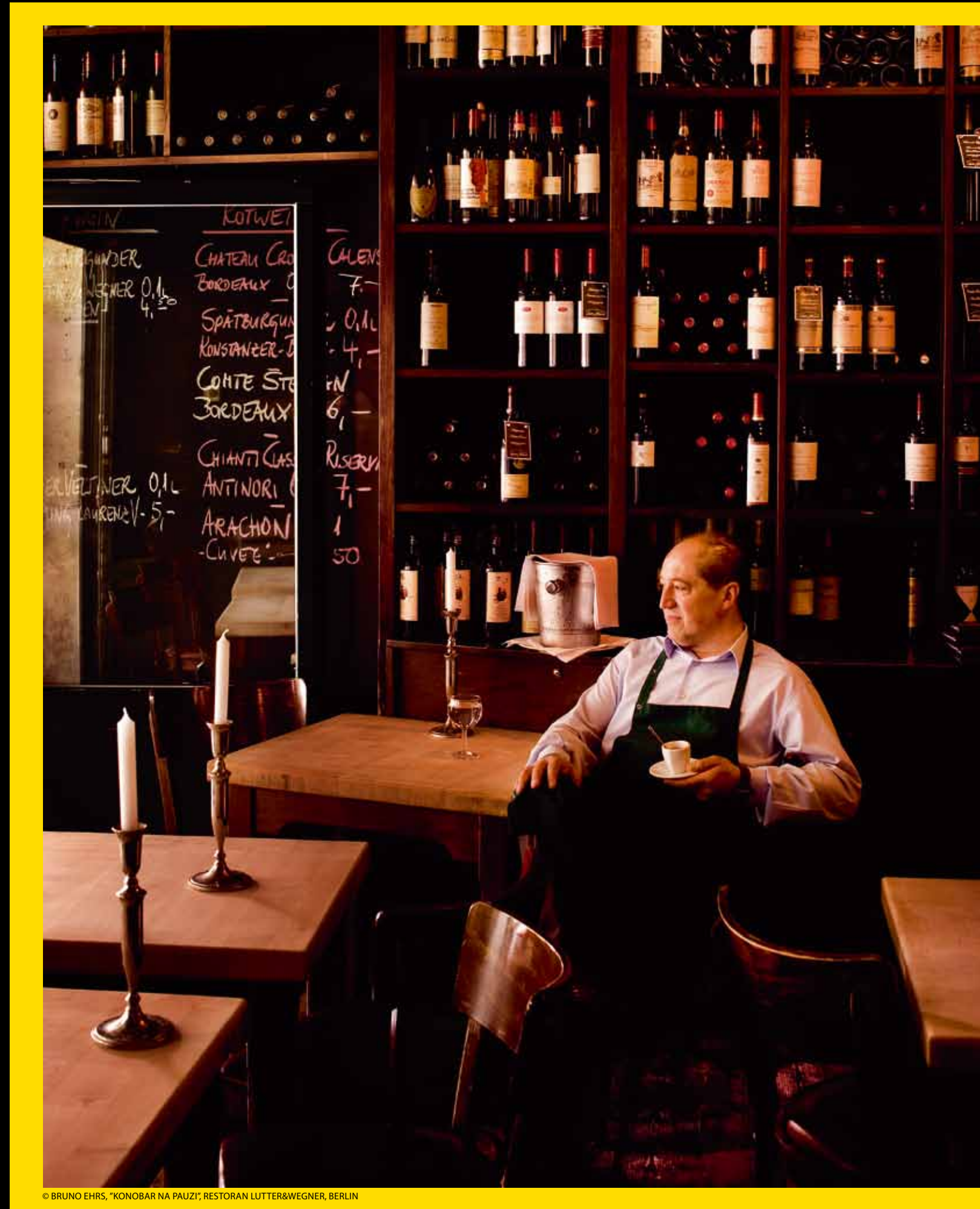
© BRUNO EHRS, "KONOBAR NA PAUZI", RESTORAN LUTTER&WEGNER, BERLIN