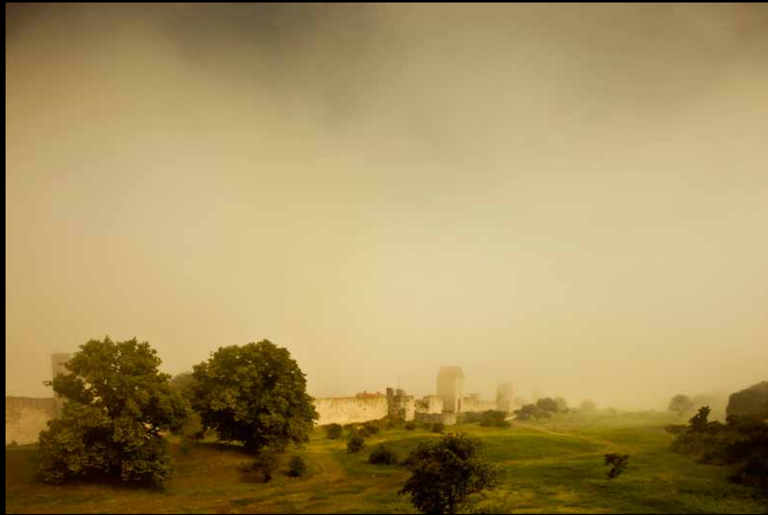
"GRADSKE ZIDINE IZ DVANAESTOG VEKA", VISBI, ŠVEDSKA

ja i sreće, dobio sam priliku da radim u sasvim drugačijem okruženju. Tokom svog slobodnog vremena, snimio sam priču o skladištima starih vozova i ljudima koji su tamo radili. Od tih fotografija napravio sam malu kolekciju i izložio je u biblioteci podzemne železnice. Izložba, u stvari, uopšte nije bila dobra, loše prezentovana bez ramova na panelima na ulazu u biblioteku. Ali, imao sam sreće. Jedan čovek koji je došao da vrati knjige pažljivo je pogledao moje fotografije i nazvao me već istog dana.