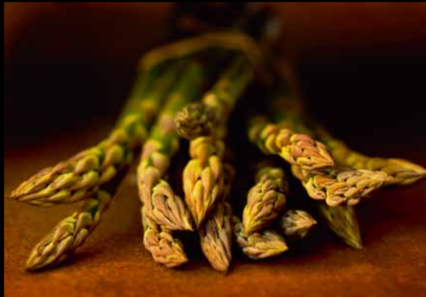
"SPARGLE", BAVARIA, NEMAČKA

Naredne dve godine koje sam proveo u časopisu Vecko Revyn bile su zabavne i poučne. Snimao sam pop zvezde, glumce... ljude iz sveta šou biznisa. Jednog dana, novopridošla glavna urednica časopisa pozvala me u svoju kancelariju. "Pregledala sam sva izdanja u protekle dve godine, i svaki put kad ugledam "otkačenu" fotografiju vidim i tvoje ime pored nje" – rekla je ona. "I šta to znači?" – upitao sam nervozno. "Da nećeš dobiti više nijedan zadatak u ovom časopisu" – hladno je odgovorila. Napustio sam njenu kancelariju sa čudnim osećanjem olakšanja, znajući duboko u sebi da je ovaj preokret spasio moju fotografsku karijeru. Tada sam odlučio da nikad više nemam "gazdu" iznad sebe i počeo sam da radim kao nezavisni fotograf.