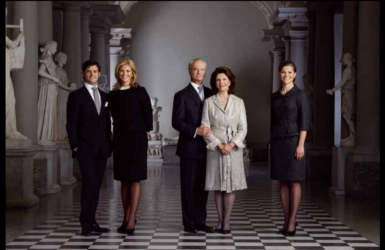
© BRUNO EHRS, "ŠVEDSKA KRALJEVSKA PORODICA", MUZEJ "GUSTAF III", ŠTOKHOLM