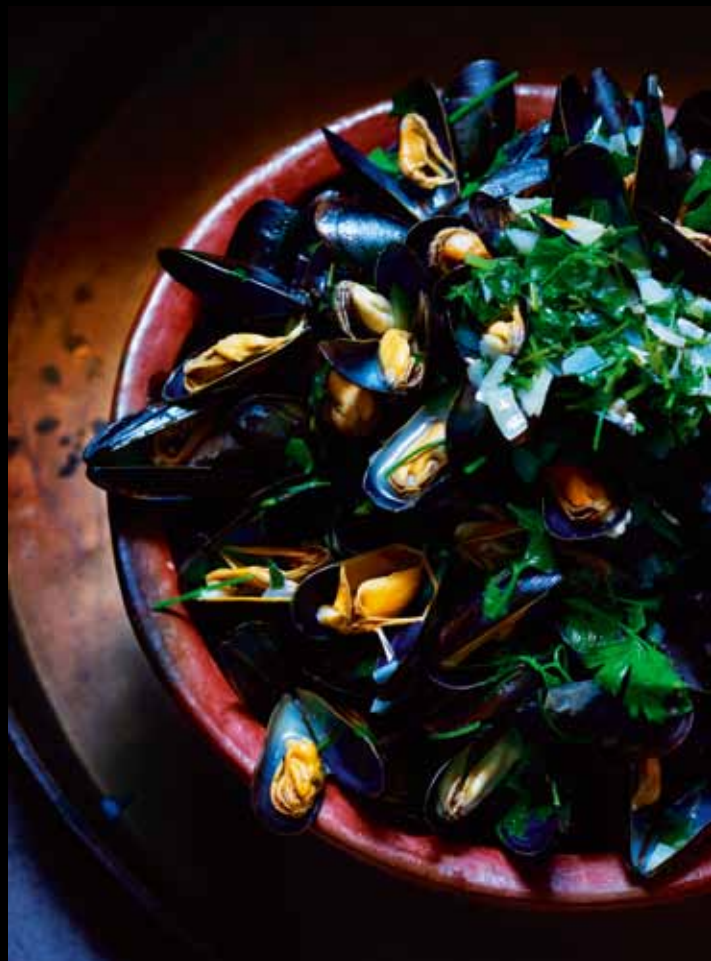
© BRUNO EHRS, "ŠKOLJKE U BELOM VINU", MARSEJ, FRANCUSKA

Svaki zadatak zahteva maksimum moje koncentracije i ništa se ne prepušta slučaju. Foto-opremu biram prema zadatku, ali skoro uvek je tu stativ, tri tilt i šift objektivna od 24, 45 i 90 mm. Zatim, tri zum objektivna, koji pokrivaju raspon žižnih daljina od 16 do 400 mm. Takoreći, to je minimum! Kada krećete na zadatak, uvek slušajte svoju intuiciju, jer realnost nikada nije potpuno predvidiva. Ali sreća ne dolazi sama – morate da joj pripremite teren. Uslovi rada nisu uvek idealni, ali vi uvek morate da isporučite dobru fotografiju. To znači da morate biti sposobni da reagujete